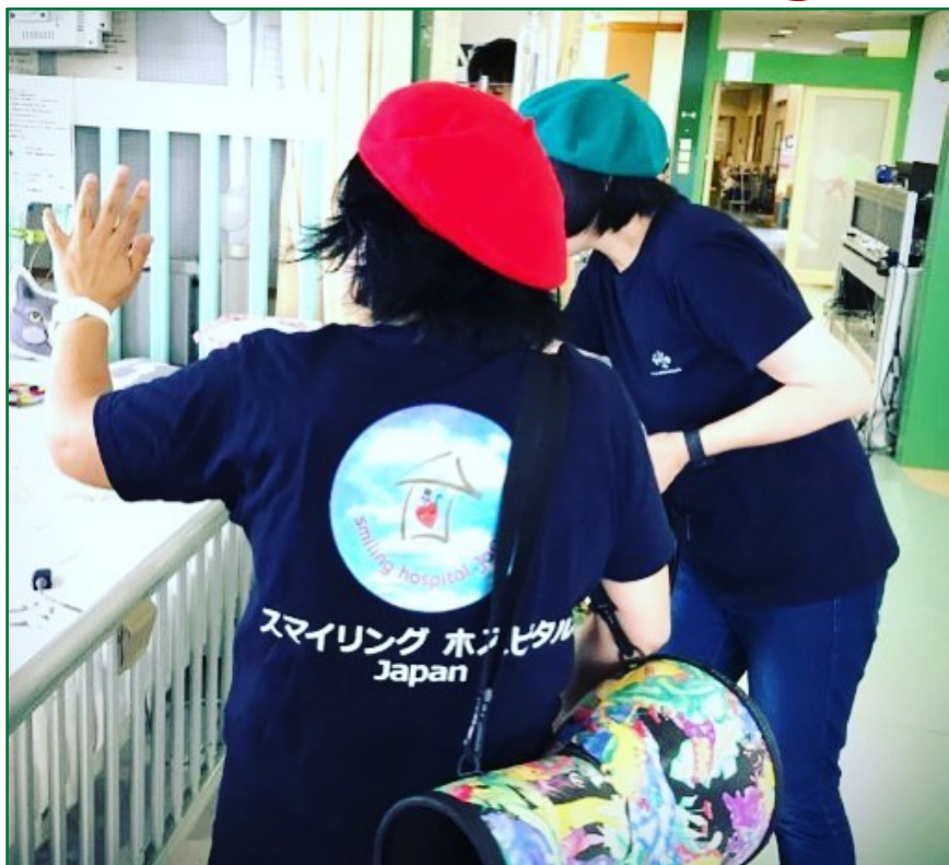
スーハーハーの音楽会@あいち小児保健医療総合センター

街はイルミネーションがきらめき、人々の往来も賑わう頃となりました。 病院や施設子どもたちも、スマイリングホスピタルジャパンのアーティストたちとオーナメントづくり やクリスマスにちなんだ音楽などで、季節を楽しんでいます。 今年1年間も順調に活動を継続、発展させることができましたことに、深く感謝申し上げます。 来年もどうぞよろしくお願いいたします。