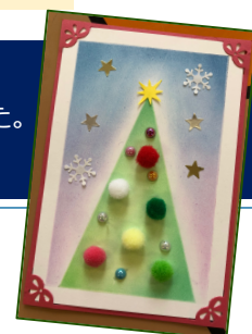
パステルアート 子どもの作品から

* 認定 NPO への寄付 (SHJ サポート会費も含まれます) は税制優遇の対象になります。 詳しくは、SHJ ホームページ「認定 NPO について」をご覧ください。か、所轄税務署にお尋ねください。